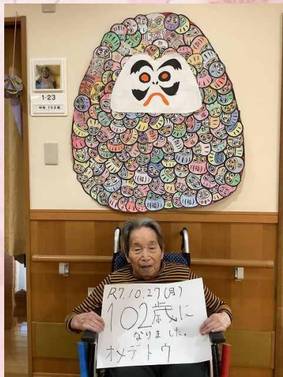
102歳、おめでとうございます！