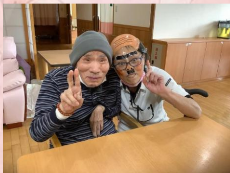
仮装した職員さんとハイチーズ！