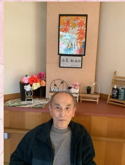
画伯は自分の作品と記念写真！