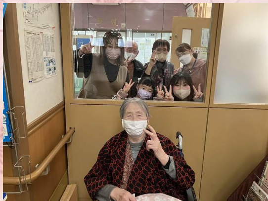
ひ孫との窓越し面会！